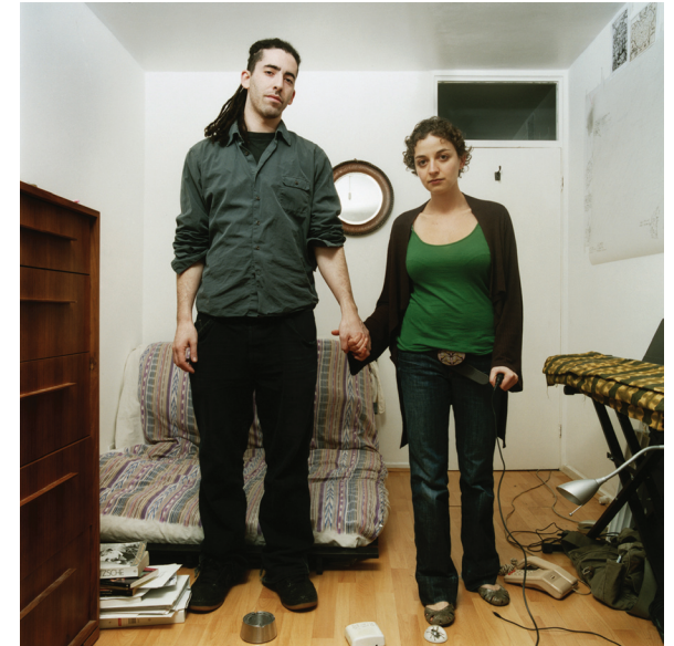
Lucy Levene, Untitled , 2007 Marrying-In (Please God By You) series