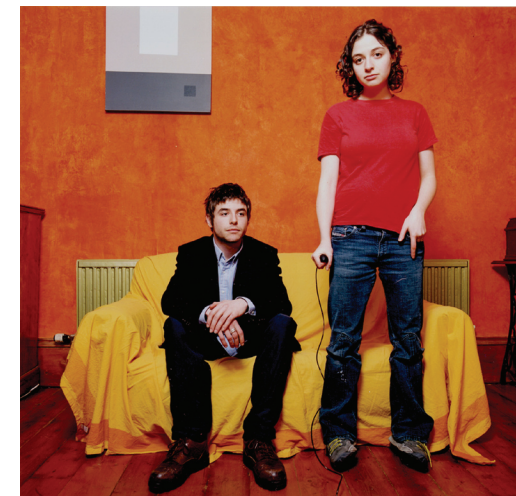
Lucy Levene, Untitled , 2002 Marrying-In (Please God By You) series

Montréal @ Galerie Joyce Yahouda Gallery 8 mai - 6 juin 2009 / May 8 - June 6, 2009