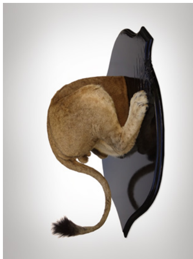
© Ghyslain Bertholon. Production Lille3000 / courtesy School Gallery / Olivier Castaing

Avec humour, Ghyslain Bertholon (né en 1972) utilise la taxidermie d'un lion pour subvertir la salle des Trophées.