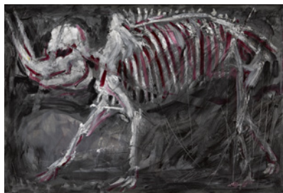
© Mark Beard. Cliché : Raphaël Chipault et Benjamin Soligny