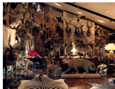
© David Chancellor - Kiosk. Paris, musée de la Chasse et de la Nature

Le portrait de Pertuiset est accroché à proximité d'une photographie contemporaine de David Chancellor (né en 1961), extraite de la série « Safari club » : un chasseur poursuit sa chasse mentale, au gré d'un exercice de remémoration, au milieu d'une galerie de trophées africains accrochés aux murs.