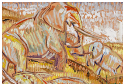
© Marck Beard. Cliché : R. Chipault et B. Soligny (détail)