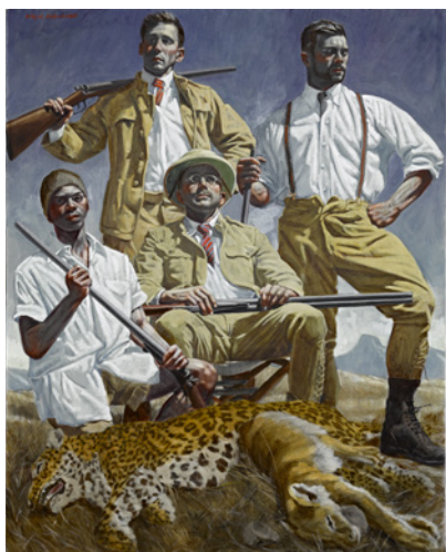
© Marck Beard. Cliché : Raphaël Chipault et Benjamin Soligny