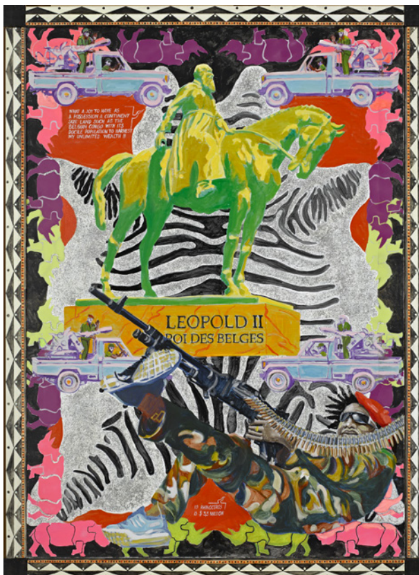
© Marck Beard. Cliché : Raphaël Chipault et Benjamin Soligny