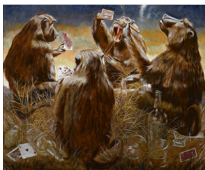
© Marck Beard. Cliché : Raphaël Chipault et Benjamin Soligny