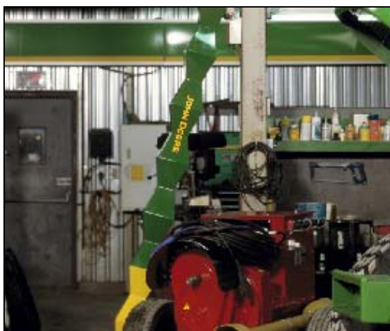
Brancusi-John Deere (détail / detail)

L'installation Brancusi-John Deere de Dominique Toutant poursuit avec humour son intérêt pour les icônes de l'histoire de l'art, une démarche déjà entamée en 2005 avec l'œuvre Brancusi en mouvement . Cette nouvelle exposition réinvente la colonne sans fin de Brancusi comme sculpture en métal de facture industrielle aux allures pop et aux connotations utilitaires.