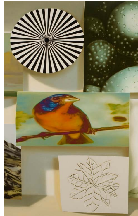
Locataire (détail), 2008, huile et acrylique sur toile